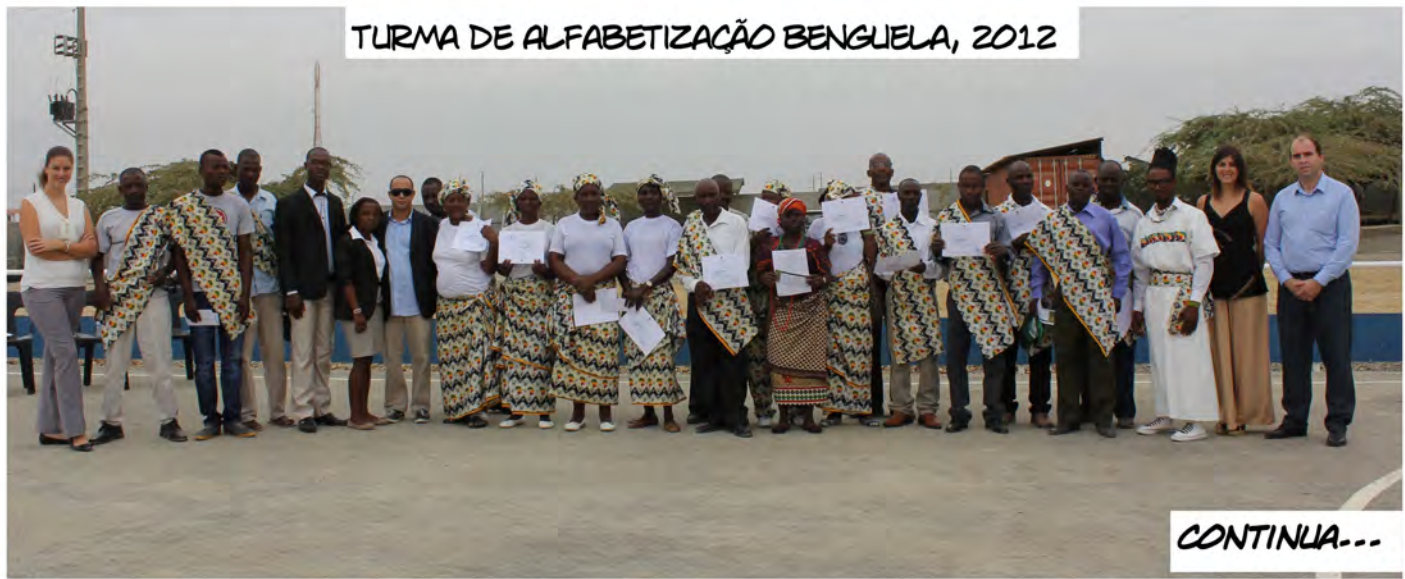
TURMA DE ALFABETIZAÇÃO BENGUELA, 2012